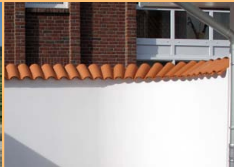
Viellja castilla Viellja castilla